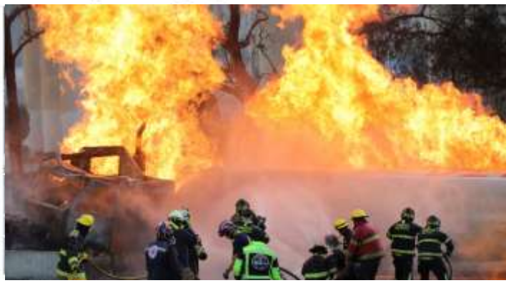
Una explosión en Ciudad de México causa la muerte de 8 personas y deja al menos 90 heridos

Y miremos también el horrible evento apocalíptico ocurrido en Ciudad de México, algo que no habíamos llegado a ver antes, hermanos yo creo que en ninguna ciudad del mundo, básicamente nunca habíamos visto que en plena autopista de una ciudad con un gran tráfico de vehículos de repente se volcara un camión con gas propano y estallara en llamas, envolviendo por supuesto a más de 90 personas en la llama y las escenas de personas desnudas o semidesnudas, con la piel quemada son realmente apocalípticas, hermanos y nos revelan los terribles eventos que se avecinan al mundo cuando caiga del cielo fuego y azufre ¡Verdad hermanos! Es decir, imaginémonos que una bola de fuego caiga en la mitad de una autopista, es lo