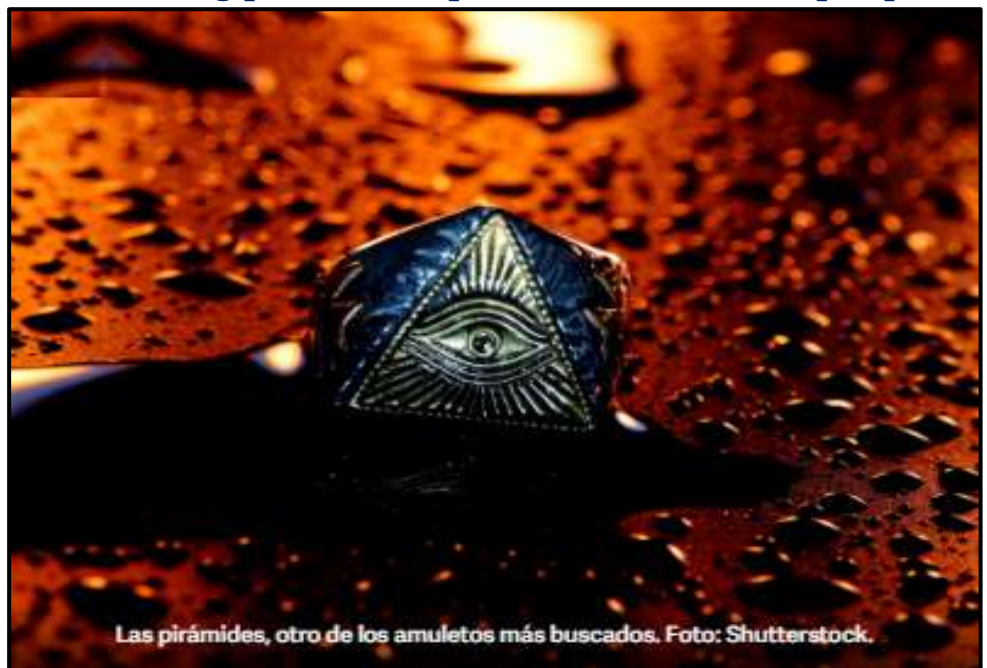
Las pirámides, otro de los amuletos más buscados.

Recordemos que el símbolo de Egipto es una pirámide, es curioso porque la pirámide ha sido siempre idolatrada como un símbolo de prosperidad y ahora lo que nos muestra la palabra es que Egipto colapsa, ¿cuál prosperidad de la pirámide? ¿Cuál prosperidad de Egipto? es una nación fracasada, es una nación que va al colapso, ¿Qué ejemplo de nación es Egipto? y ¿Qué símbolo de riqueza es la pirámide? ninguno, toda su riqueza se fue a la porra, qué pueden esperar los