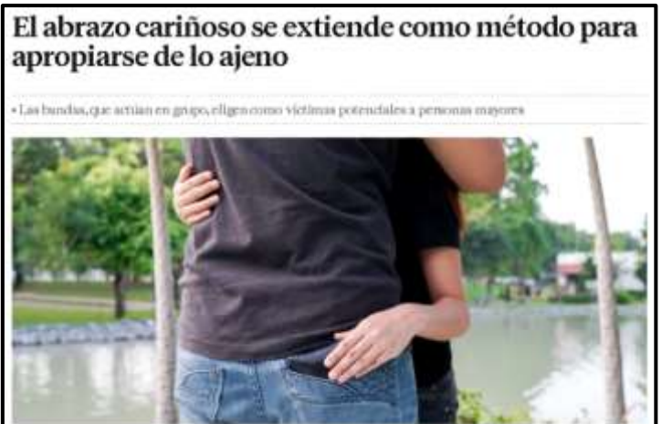
El abrazo cariñoso se extiende como método para apropiarse de lo ajeno

« Las bandas, que actúan en grupo, eligen como víctimas potenciales a personas mayores