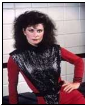
V - LA BATALLA FINAL

Ahora veamos los colores del evento conmemorativo de Charlie Kirk, miremos ese rojo y ese negro, son los colores de una teocracia distópica, es decir, si hablamos de patriotismo, como ellos se presentan, como patriotas, tal vez debieron usar colores más alusivos a la bandera de Estados Unidos, colores como el blanco, el azul, si se quiere inclusive el verde, pero los colores rojo y negro, plop. Hermanos, si nosotros vemos series de televisión de tecnocracias distópicas, como por ejemplo: V - La Batalla Final, los