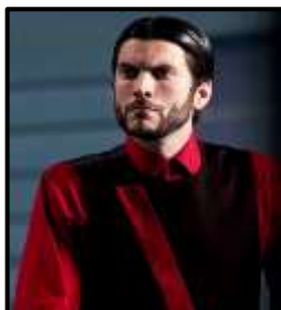
JUEGOS DEL HAMBRE