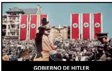
GOBIERNO DE HITLER

uniformes de los extraterrestres eran rojo y negro, pero miremos la serie de los Juegos del hambre, en donde hay una sociedad distópica que se impone en Estados Unidos a través del miedo