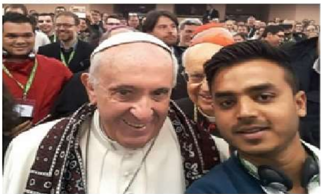
Selfie de paquistaní con el papa Francisco se vuelve viral

Lucas, capítulo 4, versículo 6; Y le dijo el diablo: A ti te daré toda esta potestad, y la gloria de ellos; porque a mí me ha sido entregada, y a quien quiero la doy.