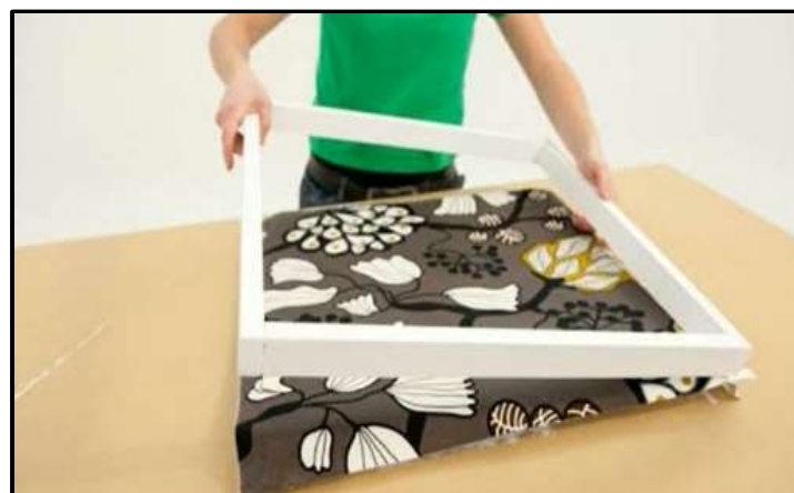
Construir un marco sencillo para un lienzo - Bricomania

subordinado a nadie, entonces vemos que Jesús nos enseña que el amor no es independiente de la ley, ni la ley es independiente del amor, al contrario el amor depende de la ley, es decir, el amor está subordinado a la ley, ahora otra traducción dice que la ley está colgada del amor, es decir, que el amor es como un marco de un cuadro y la ley es el lienzo que debería ir colgada de ese marco y cuando esté el marco junto con el lienzo entonces vemos la plenitud del amor y de la ley, por eso se dice que así como un lienzo cuelga del marco asimismo la ley cuelga del amor. Entonces vemos que la ley también es hacer lo bueno, que en este caso es el amor iverdad! cuando tú amas a alguien, pues, velas por hacer lo bueno para esa persona. Leamos en: