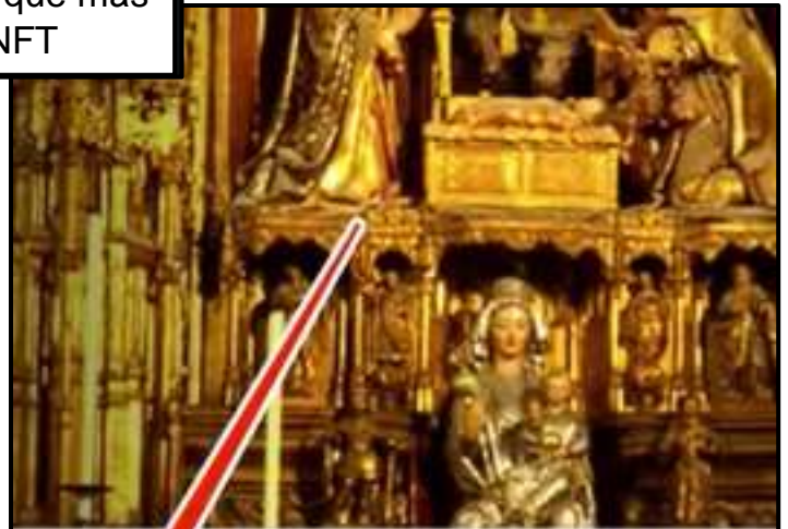
El oro de la Iglesia Católica, la mayor reserva del mundo

que este es su objetivo, imponer sus dogmas religiosos en cada ser humano, obligándolo a obedecerlos o de lo contrario no podrá comprar ni vender, es lo que viene, sin embargo, lo que muchos piensan que sería el punto cúspide del poder del Papa de Roma viene a ser realmente el punto culminante