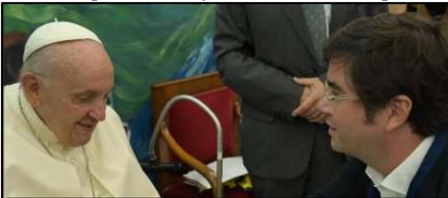
El papa Francisco se reunió con el argentino que más sabe de cripto y anuncian la creación de un NFT

Así que ahí vemos la riqueza de la Iglesia Católica que es también el secreto de su gran poder, pues, es una iglesia llena de oro, piedras preciosas y perlas costosísimas ¿Qué va a pasar cuando todo eso pierda valor, debido a que se pone un nuevo sistema en el mundo? un dinero digital, algo que nunca se había visto en la historia del mundo. Entonces alguien pensaría que ese sistema de dinero digital representa la cúspide del poder del vaticano porque ahora ellos pueden ordenarle a las personas a que obedezcan sus dogmas o de lo contrario les prohibirán comprar y vender, es un sistema de crédito social global que está por ser impuesto en el mundo, usando el dinero digital y por supuesto la iglesia católica es quien lidera esta agenda, inclusive, el Papa Francisco ya ha lanzado cripto monedas y se ha reunido con expertos en cripto monedas porque sabemos