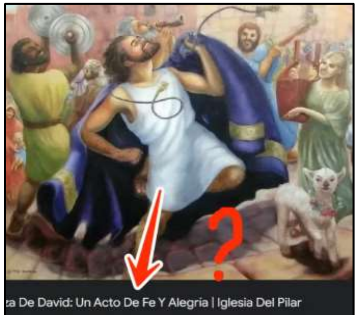
La Danza De David: Un Acto De Fe Y Alegría | Iglesia Del Pilar