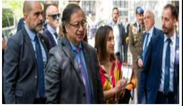
Petro enciende alarmas al incitar a "una revolución" en Colombia

El hecho de que Donald Trump haya ganado la presidencia no quiere decir que esa revolución que tanto hemos estudiado, que está siendo preparada por los altos poderes globales no vaya a ocurrir, claro que sí va a ocurrir y se va a desatar en cualquier momento, nosotros no nos vamos a apartar de la profecía, recordemos que el anticristo es descrito en la palabra como el hombre sin ley, otras traducciones lo llaman el hombre de pecado, pero cuando miramos esta traducción que dice: Hombre sin ley, también podemos entender que es el hombre de caos, el hombre del desastre, de la revolución, es el anticristo, que es el Papa de Roma, desde Roma es donde se preparan las guerras, las revoluciones y nosotros hemos visto al anticristo