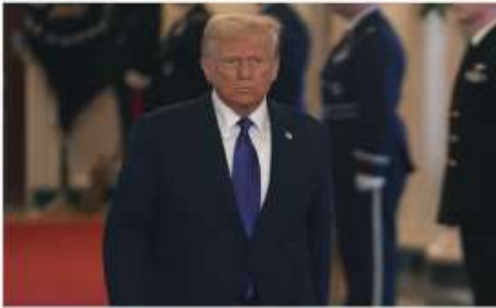
Trump ordena habilitar un centro de detención en Guantánamo para migrantes ilegales

fascista en Europa que muchas personas piensan que de ahí viene el fascismo y, no, el fascismo viene de mucho tiempo atrás, pero este gobierno fascista es el gobierno de Hitler y nosotros en el gobierno de Hitler vimos toda la manera de comportarse del fascismo, entonces ¿Qué hizo Hitler? de inmediato empezó a deportar a los judíos, a declararlos como enemigos públicos número uno, ¿Por qué? Porque eran la minoría, porque eran inmigrantes, asimismo Hitler empezó a pasar leyes animalistas, ecologistas, luego pasó leyes sanitarias, lo vemos hermanos, es la fórmula, está perfecta la fórmula del fascismo, sea cristiano, sea judío, sea pagano, está totalmente clara. Miremos hermanos como Hitler empezó a enviar a campos de concentración a personas inocentes, su único delito era ser minoría, no es impresionante hermanos que Donald Trump ha dicho que va a enviar a los inmigrantes a su campo de concentración que él tiene en Guantánamo y también ha