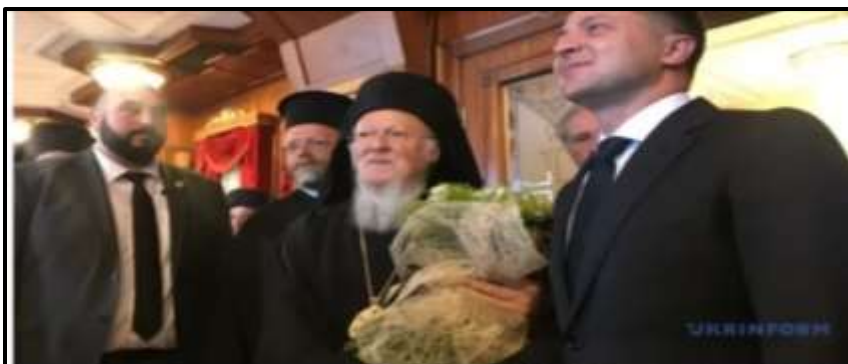
Presidente de Ucrania habla por teléfono con el Patriarca Ortodoxo de Constantinopla

Recordemos hermanos que la Iglesia Católica se ha inventado la adoración a María, la madre de Jesús, la cual ellos dicen que nunca murió sino que subió viva al cielo libre de pecado, cosa que no aparece por ningún lado en la Biblia y como si fuera poco, pues, la han convertido en una diosa y además en cointercesora con Jesús, es decir, que ella también puede perdonar pecados y te puede hacer ganar la salvación eterna.