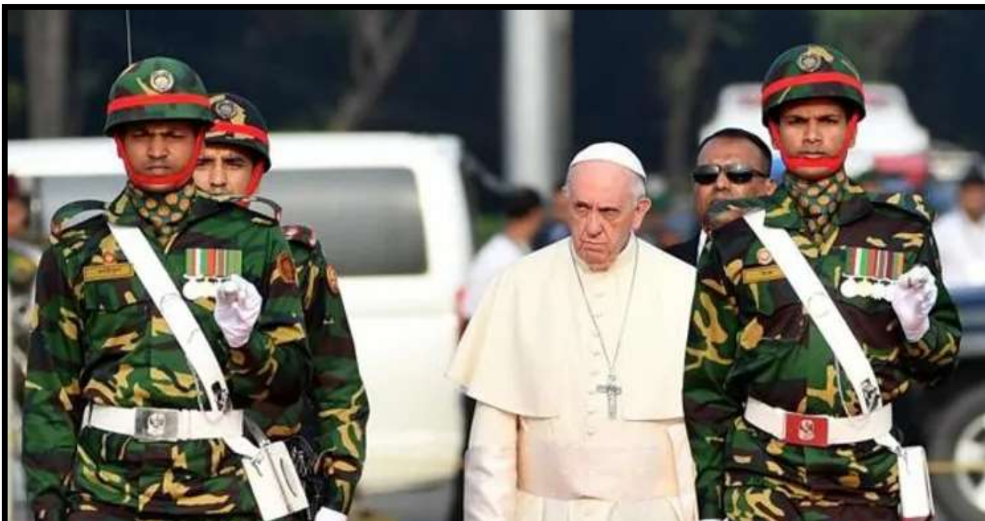
EL PAPA FRANCISCO MULTA CON $$$100 A MUJER Y LUEGO LA EXCOMULGA

¡Hola hermanos! Oremos hoy a nuestro Padre eterno, Padre amado, te damos gracias porque nos has llamado a ser parte de tu pueblo santo, nos sentimos felices pero también reconocemos que debemos demostrar que realmente queremos irnos a vivir contigo en una ciudad santa, por eso hoy te oramos en humildad para que nos tomes de la mano y nos introduces en la vida eterna, en la santa ciudad celestial. En el nombre de Jesús. Amén.