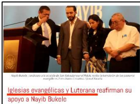
Iglesias evangélicas y Luterana reafirman su apoyo a Nayib Bukele

Esta es la victoria de Jesús que le pisa la cabeza a este dragón, a esta serpiente antigua y también a sus ángeles y no ocurre a través de la violencia o la fuerza bruta sino que es pacíficamente, guardando los mandamientos de Dios, así es como Jesús le pisa la cabeza a la serpiente hermanos, esa es la clave y fue así como Jesús logró la victoria guardando en obediencia absoluta los mandamientos de Dios, inclusive en momentos de dificultad, en momentos de sufrimiento y de dolor Jesús continuó obedeciendo los mandamientos de Dios y fue así como le pisó la cabeza a la serpiente, fue así como el demonio fue expulsado del cielo con sus ángeles caídos, no fue a través de la violencia, fue a través de la obediencia a los mandamientos de Dios y si estos pastores quieren que haya una sociedad mejor y una sociedad donde se proteja la familia, que empiecen primero ellos guardando los mandamientos de Dios pero no lo van a hacer hermanos porque algunos de ellos son ángeles caídos, plop.