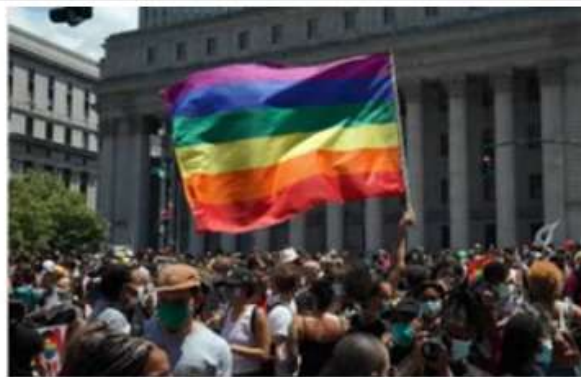
Marcha LGTB en el bajo Manhattan, Nueva York, el 28 de junio de 2020.

Ya hemos visto este comportamiento, el ser humano es loco hermanos y ellos toman la causa del problema y la convierten en la solución del problema; entonces: "Oh como estamos en una crisis de moralidad vamos a unir a la Iglesia con el Estado" cuando la culpable de la inmoralidad es la iglesia hermanos, plop. Entonces cómo va a ser que una iglesia en apostasía va a lograr restaurar un estado corrupto no es posible, al contrario el Estado va a tomar la apostasía de la iglesia y la va a convertir en Ley de Estado, obligando a toda la nación a ser corrupta y ahora por decreto de Estado, miremos el problema hermanos, es una cosa de locos, por eso la biblia la llama bestia. Me acuerdo