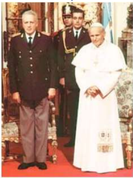
Wojtyla fue recibido por el dictador Galtieri.

Hermanos y es una noticia que nos revela un tremendo cumplimiento de la