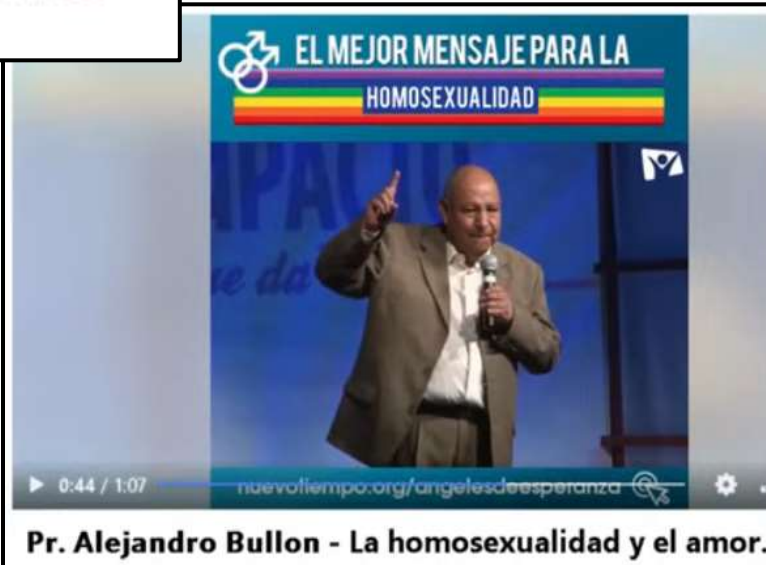
Pr. Alejandro Bullon - La homosexualidad y el amor.

reciben convenios con el Estado, tienen fundaciones de beneficencia y a través de esas fundaciones hacen convenios con el Estado y de esa manera se enriquecen fabulosamente. Entonces ¿qué pasa hermanos? hay una apostasía en estas iglesias y eso ha generado